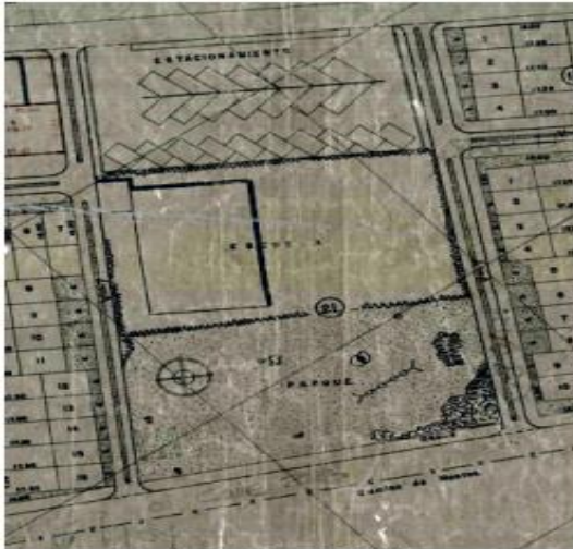
Copia parcial plano de loteo 523/4-1

El predio cuenta con plano de loteo No. 523/4-1 denominado, “URBANIZACIÓN “VERAGUAS”, aprobado mediante memorando referencia 6598 del 29 de diciembre de 1965; en donde se identifica según el cuadro de áreas como: “CUADRO GENERAL DE ÁREAS – DESTINACIÓN (PARQUE-ESCUELA – ESTACIONAMIENTO-MANZANA 21)”, de acuerdo con las siguientes imágenes: