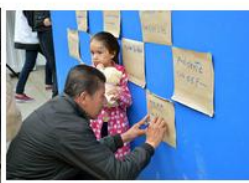
Comunidad comprometida con la veeduría de las obras