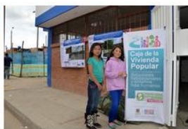
Los jóvenes también tomaron partido y se comprometieron como corresponsables.