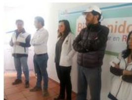
Entregas en Mirador de Bolonia