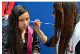
Se realizaron actividades lúdicas con niños: Pintucaritas