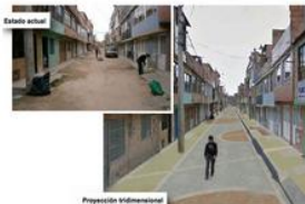
Proyección de arreglo de vía y andenes