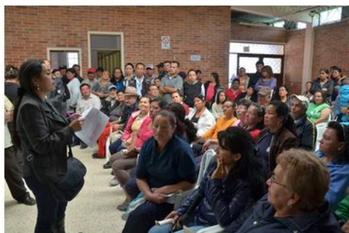
Fecha Original de publicación: 2014-02-13