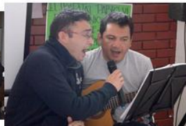
Cierre de la actividad con serenata para la comunidad