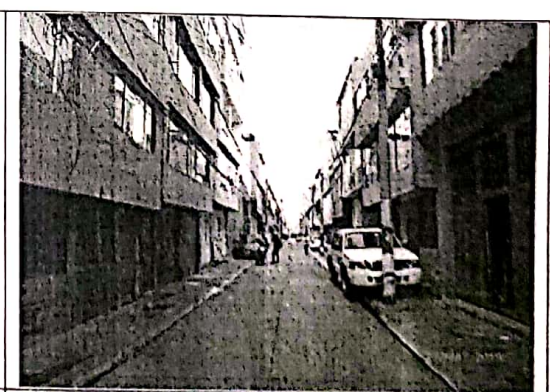
Fotografía N° 2. Panorámica carrera 83 No 5A - 49, vista hacia el sur.