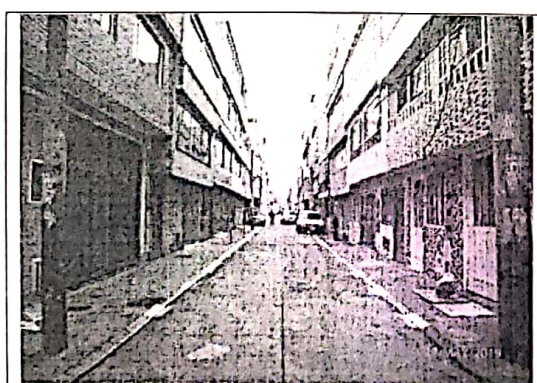
Fotografía Nº 1. Panorámica carrera 83 No 5A – 4: vista hacia el norte.

A continuación se muestra registro fotográfico de la visita técnica realizada el día 27 de Mayo de 2019.