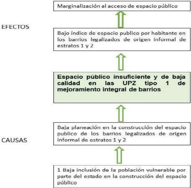
ARBOL DE PROBLEMAS

El problema central determinado; por el equipo de la dirección de mejoramiento de barrios y basado sobre la estructura de árbol de problemas es: Espacio público insuficiente y de baja calidad en las UPZ tipo 1 de mejoramiento integral.