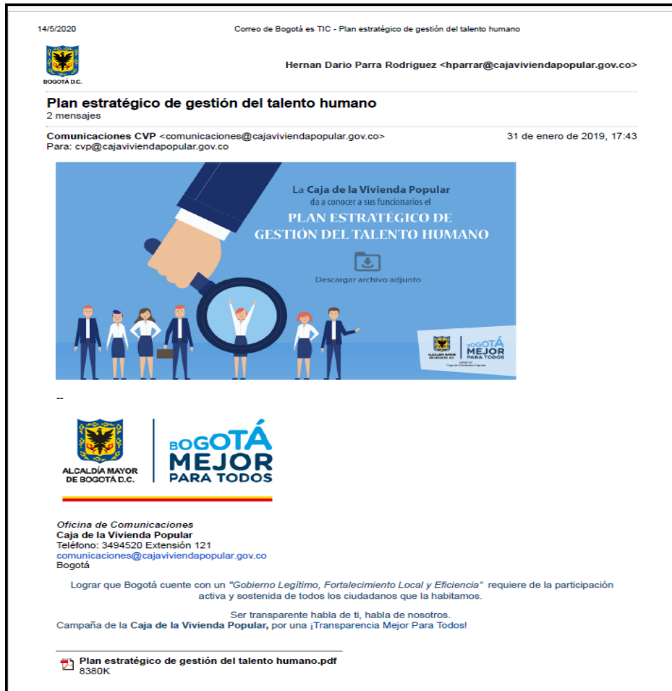
Imagen No 1

NO CONFORMIDAD No 1 – Subdirección Administrativa: Incumplimiento del numeral 7.5.3 de la ISO 9001:2015: Control de la información documentada, literal d) Conservación y disposición.